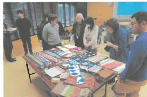
ニュートラの学校入門編 in 新潟