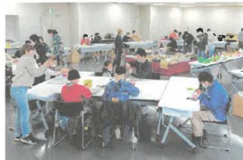
オープンアトリエ@平城宮跡歴史公園

障害のある人、ない人、誰もが参加できるアトリエ「オープンアトリエ」。各地での実践の紹介と、必要なサポートの考え方や環境づくりについて学びます。(講義や講師紹介、ノウハウ提供など、運営のコンサルティングまでおこないます)