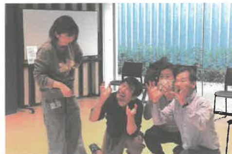
ワークショップ「障害のある人との身体表現から創造的な福祉の現場をつくるヒントを学ぶ」